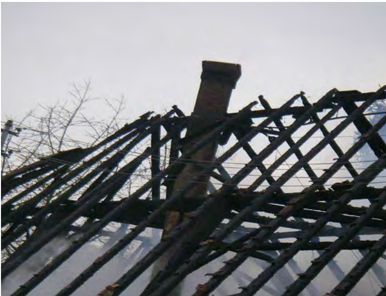
Abbildung 16: Schornstein kurz vor dem Einstürzen nach einem Dachstuhlbrand

Einsturzgefährdet ist bei längerer Brandeinwirkung auch der Schornstein. Schornsteine sind sehr lange und dünne Gebilde, welche sehr leicht einknicken. Schornsteine werden aus diesem Grund seitlich durch den Dachstuhl gestützt. Brennt diese Stütze weg, so verliert der Schornstein erheblich an Stabilität und kann leicht z. B. durch Erschütterungen oder Windböen zum Einsturz gebracht werden.