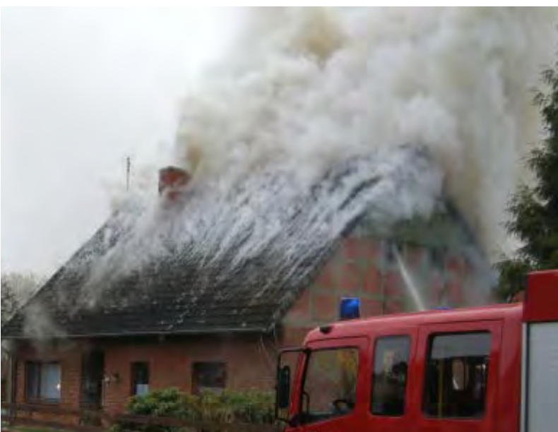
Abbildung 5: Typische Rauchentwicklung als Anzeichen eines bevorstehenden Aufbrennens des Dachstuhls

Ein solches Aufbrennen lässt sich nicht sicher vorhersagen, jedoch zeigt sich oftmals vor einem Aufbrennen eine typische Rauchentwicklung. Das Aufbrennen eines Dachstuhls und die Rauchentwicklung stehen grundsätzlich in keinem Zusammenhang. Ein Aufbrennen eines Dachstuhls ist von der Abbrandgeschwindigkeit an den Dachlatten abhängig und tritt nach rund 15 bis 30 Minuten Brandeinwirkung auf die Dachlatten ein (siehe Abschnitt 1.3. ). Dies setzt aber einen deutlich fortentwickelten Brand voraus, der auch eine typische Rauchentwicklung zeigt: Der Rauch drückt in diesem Fall auf großer Fläche zwischen den Ziegeln hindurch, was zu einer besonderen Musterung im Rauch führt (siehe Abbildung 1, 4, 5, 6 und 8). Optisch erweckt dies den Anschein einzelner „Rauchstreifen“ oder eines „Gitters“ über der Dachfläche. Erst über dem Dach nimmt der Rauch an Volumen zu und steigt nur noch langsam auf. Die Rauchfarbe ist dabei meist hellgrau. Achtung: Bei starker Isolierung des Daches kann diese Rauchentwicklung auch nur sehr gering ausfallen und kaum beobachtbar sein.