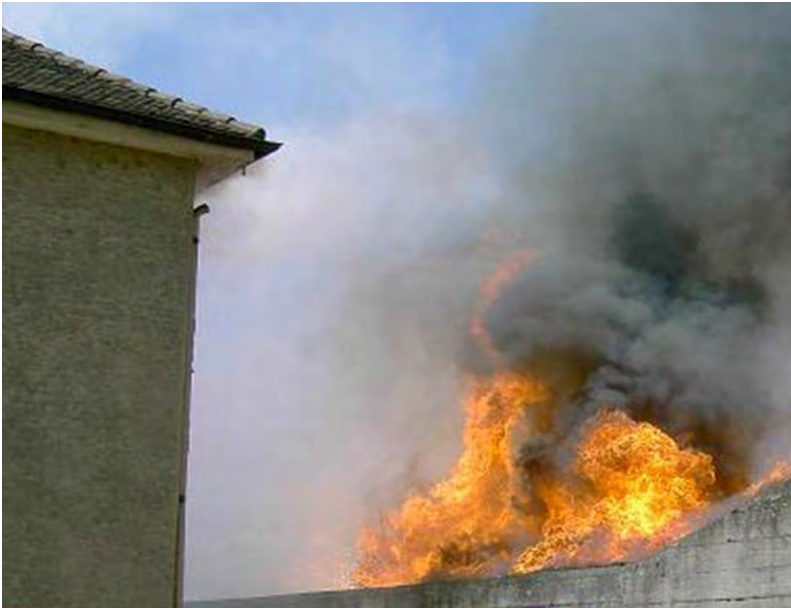
Abbildung 12: Gefahr der Ausbreitung durch Wärmestrahlung – eine leichte Rauchentwicklung ist im Bereich des Dachvorsprungs bereits erkennbar