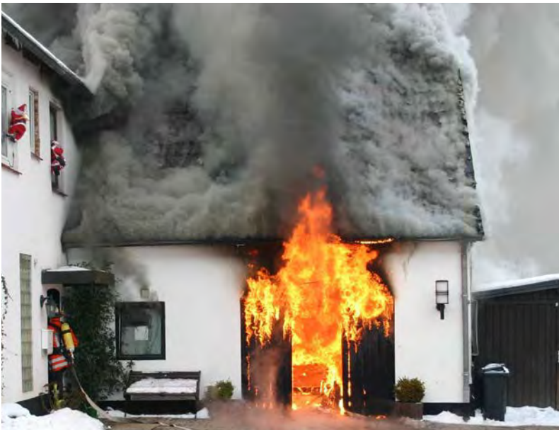
Abbildung 6: Das Feuer im Erdgeschoss hat sich schon auf den Dachstuhl ausgebreitet; dieser steht kurz vor dem Aufbrennen

In der ersten Phase des Aufbrennens lassen sich oftmals, aufgrund der starken Rauchentwicklung über dem Dachstuhl, die eigentlichen Flammen noch gar nicht erkennen. Ein sicheres Anzeichen für ein erfolgtes Aufbrennen ist in dieser Phase, wenn eine dunklere und deutliche schnellere Rauchsäule aus der relativ hellen Rauchwolke über dem Dachstuhl emporsteigt.