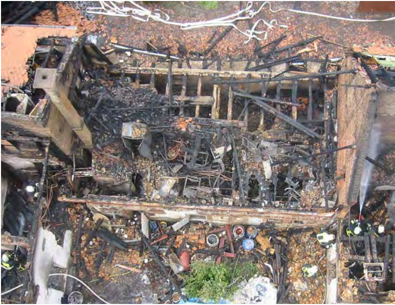
Abbildung 17: Komplett eingestürzter Dachstuhl nach einem Brand – Die Schäden am hölzernen Dachstuhl lassen auf eine Branddauer von bis zu 50 min schließen