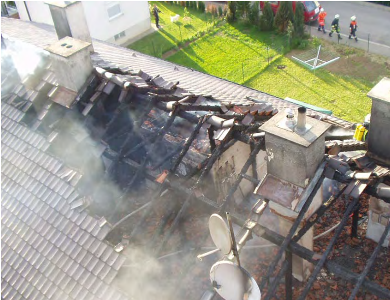
Abbildung 2: Der Dachstuhlbrand hat sich zur linken Giebelseite hin ausgebreitet

Besonders groß ist diese Gefahr bei Doppelhäusern mit durchgehender Dachkonstruktion. Hier stellen die Giebelwände keine brandschutztechnische Abtrennung dar. Das Feuer kann sich hier schnell auf die andere Haushälfte ausbreiten.