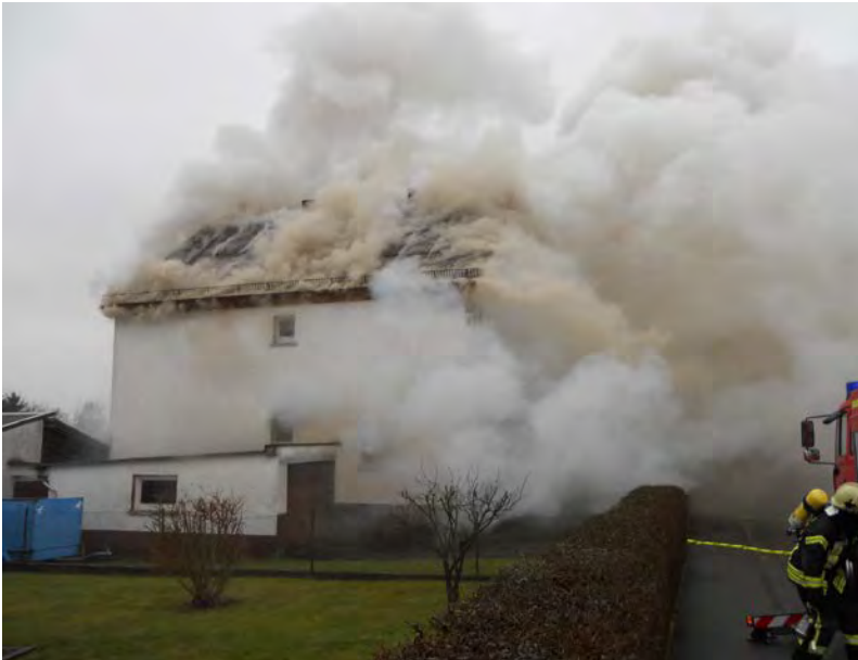
Abbildung 9: Turbulenter Rauch mit einer Braun-/Gelbfärbung – ein Hinweis auf die Pyrolyse von Holz – kurz vor der Rauchgasdurchzündung des hölzernen Dachstuhls