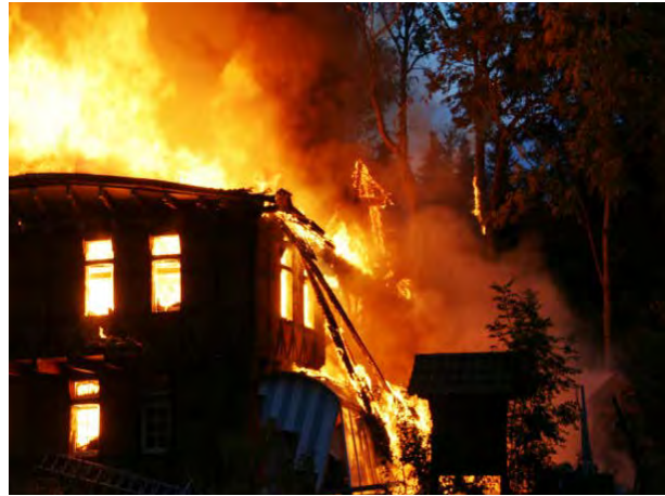
Abbildung 15: Einstürzende Giebelwand bei einem Dachstuhlbrand