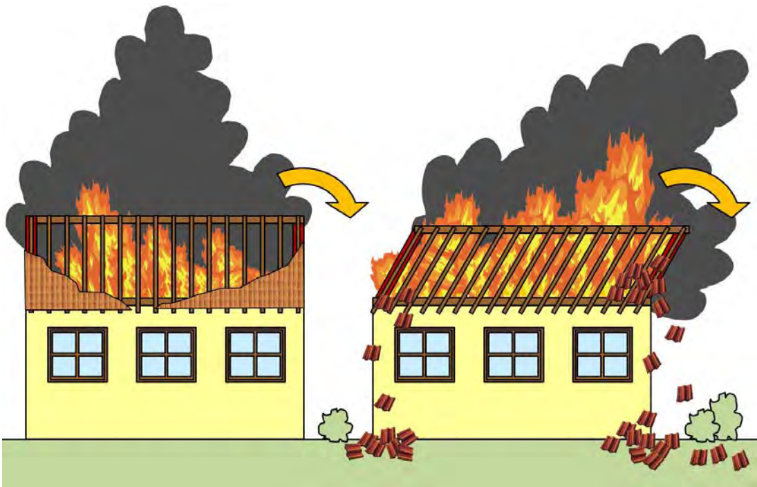
Abbildung 14: Eine zur Seite hin einstürzende Giebelwand kann über die Firstpfette auch die Sparren und die zweite Giebelwand mitreisen.

Hiervon sind jedoch nicht nur die Sparren betroffen. Auch die beiden Giebelwände verlieren mit dem Dachstuhl ihre Stabilität. Giebelwände stürzen in der Regel beim Versagen nach außen. Achtung: Bei einem Einsturz einer Giebelwand kann die Firstpfette die Sparren und sogar die zweite Giebelwand mitreisen. Der Dachstuhl und die Giebelwände kippen dann wie ein Parallelogramm zu einer Seite hin um.