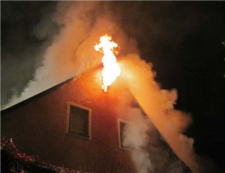
Abbildung 7: Kleinere Flammenverlängerung aus einem Giebfenster

Der gleiche Effekt lässt sich auch bei einem Schweißbrenner erkennen: Stellt man die Sauerstoffzufuhr ab, so wird die Flamme deutlich länger – die Verbrennung benötigt mehr Zeit, da der entsprechende Sauerstoff aus der Umgebung erst in die Flamme eingemischt werden muss.