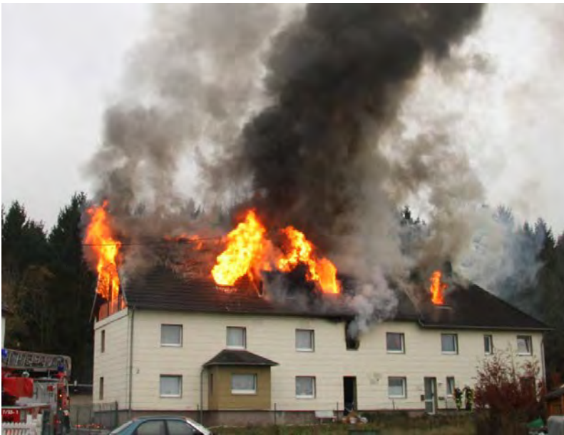
Abbildung 18: Erste Frontalansicht bei einem Dachstuhlbrand