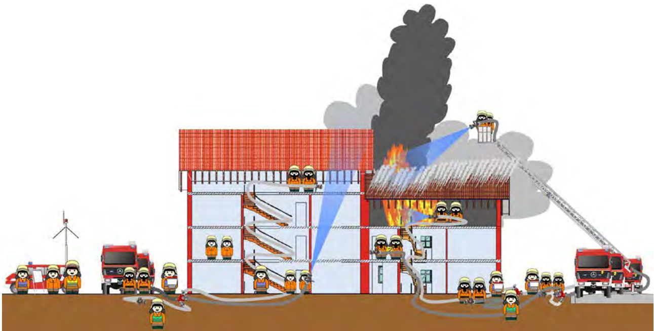
Abbildung 20: Lagebild zum Einsatzbeispiel

Der ELW 1 und die Führungsgruppe unterstützen den Kommandant bei der Einsatzleitung. Dieser hat mittlerweile noch einen weiteren Löschzug, als Taktische Reserve und zum Austausch von Atemschutzgeräteträgern sowie den Gerätewagen Atemschutz des Landkreises nachalarmiert.