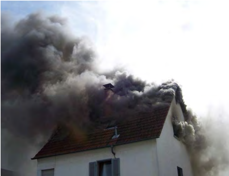
Abbildung 10: Sehr starke, dunkle und turbulente Rauchentwicklung – ein Hinweis auf eine mögliche Rauchgasdurchzündung? Die etwas dunklere und gerade aufsteigende Rauchsäule im linken Dachbereich spricht eher für einen aufgebrannten Dachstuhl und die grünlich-weiße Färbung des Rauches aus dem Giebelfenster für ein erstes Wirken der Brandbekämpfung.