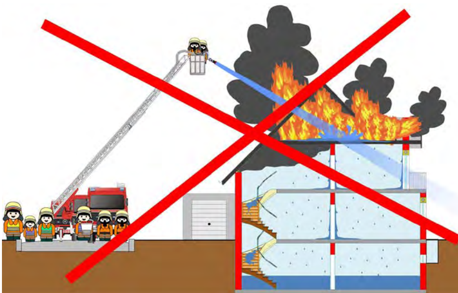
Abbildung 19: Bei einem Dachstuhlbrand in einem Wohnhaus wird ein Wenderohr nicht eingesetzt

Ein Wenderohr wird bei einem Wohnhausbrand/Dachstuhlbrand nicht eingesetzt! Von der Drehleiter aus wird die Brandbekämpfung mit einem C-Strahlrohr und mit Sprühstrahl durchgeführt