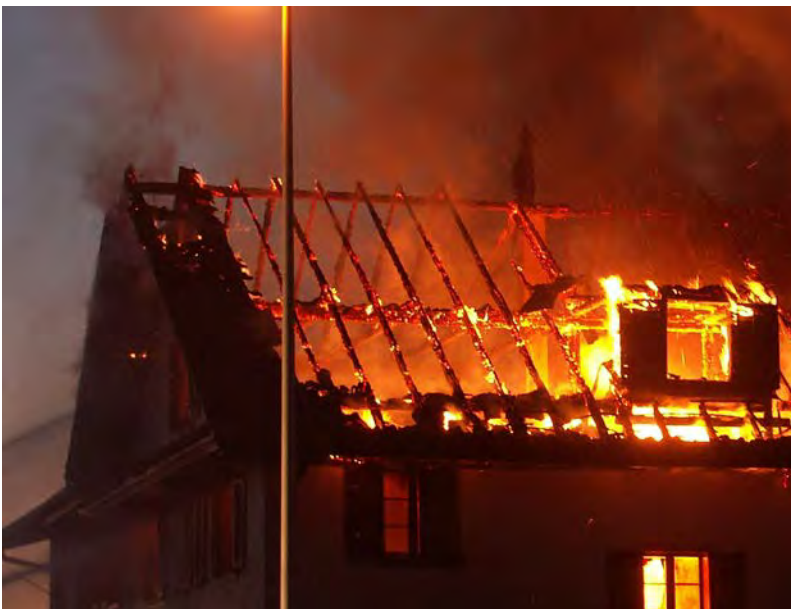
Abbildung 11: Deutlich ist das sich im Treppenraum nach unten hin ausbreitende Feuer zu erkennen

Hat das Feuer bereits auf den gesamten Dachstuhl übergreifen, so wird sich das Feuer im weiteren Verlauf nach unten hin ausbreiten. Der erste Weg hierzu ist der Treppenraum. Herabfallende brennende Teile führen hier schnell zu einer Ausbreitung.