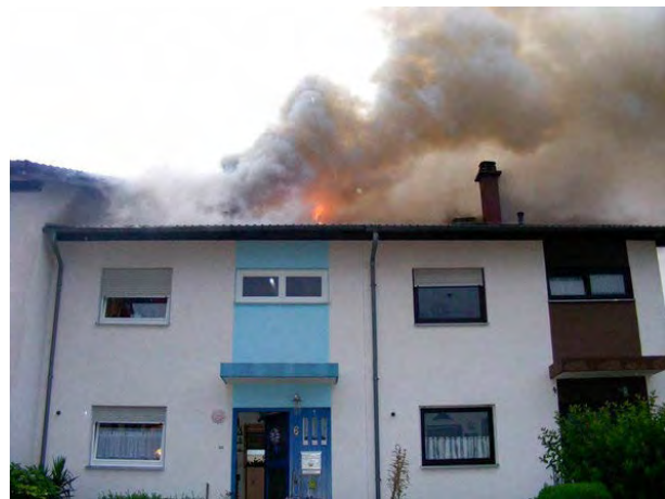
Abbildung 3: Dachstuhlbrand in einem Doppelhaus; das Feuer hat sich von der linken auf die rechte Doppelhaushälfte ausgebreitet