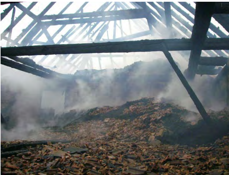
Abbildung 13: Abgestürzte Ziegel nach einem Dachstuhlbrand

Man muss also 15 bis 30 Minuten nach Beginn des Brandes mit dem Versagen der Dachlatten und dem Einsturz der Ziegel rechnen.