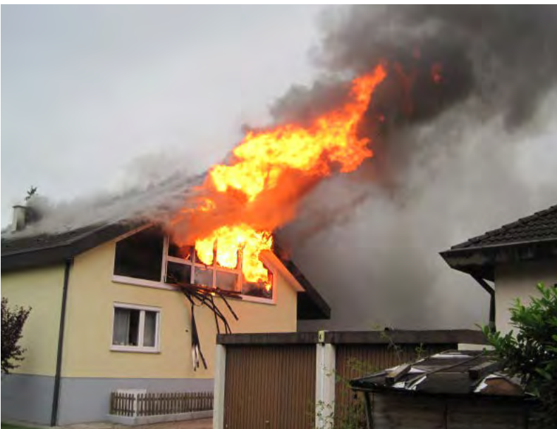
Abbildung 8: Große Flammenverlängerung bei einem Dachstuhlbrand, hierbei kann es zur erheblichen Ausbreitungsgefahr für die Nachbargebäude kommen