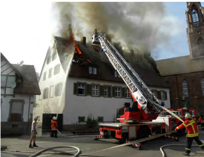
Abbildung 1: Der Brand breitet sich von der linken Giebelseite auf den restlichen Dachstuhl aus

Allgemein droht bei Bränden die Gefahr der Ausbreitung aufgrund der Thermik des Brandrauches nach oben. Bei einem Dachstuhlbrand ist diese Problematik im Normalfall nicht gegeben. Hier steht die Ausbreitung zu den Seiten hin im Vordergrund. Eine Ausbreitung zur Seite hin wird zuerst den restlichen Dachstuhl betreffen.