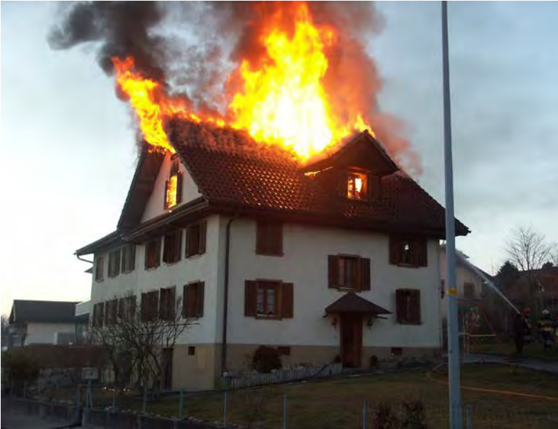
Abbildung 4: Im Firstbereich aufbrennender Dachstuhl